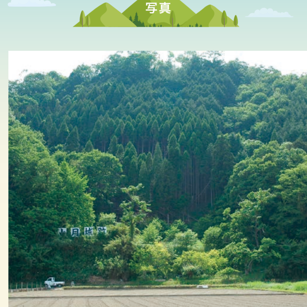
上月城をふもとから望む