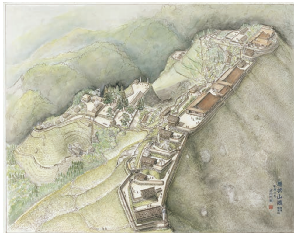
「中世播磨250の山城」(中世城郭研究家 木内内則)