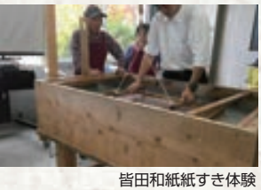
皆田和紙紙すき体験