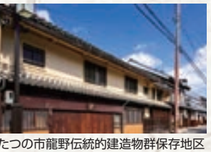
たつの市龍野伝統的建造物群保存地区