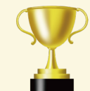
(例) 西播磨 山城マスター