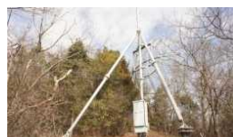
登山道途中のテレビ塔