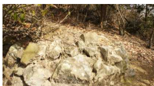
登山道で見た石 城跡?