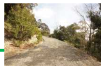
車の走れる道に合流