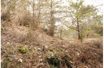
登山道横城跡のものかは分らないが階段のようになった平坦地