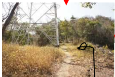
鉄塔が建っています。