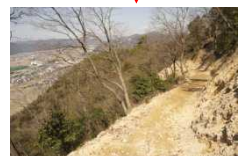
龍野町島田地区への下山道 （のろし台跡から約1時間で下山）